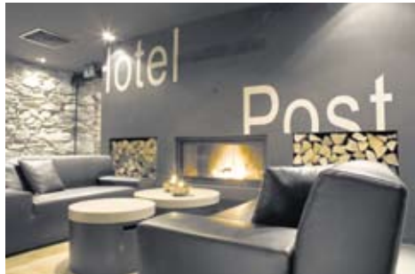
Im Unique Hotel Post trifft Tradition auf Moderne.

Die Kombination aus 20 qualitativ hochstehenden Designzimmern im Mountain-Lodge-Stil, 3 Deluxe-Loft-Zimmern, 5 Juniorsuiten sowie der Matterhorn-Suite (mit separatem Wohn- und Arbeitszimmer, atemberau-