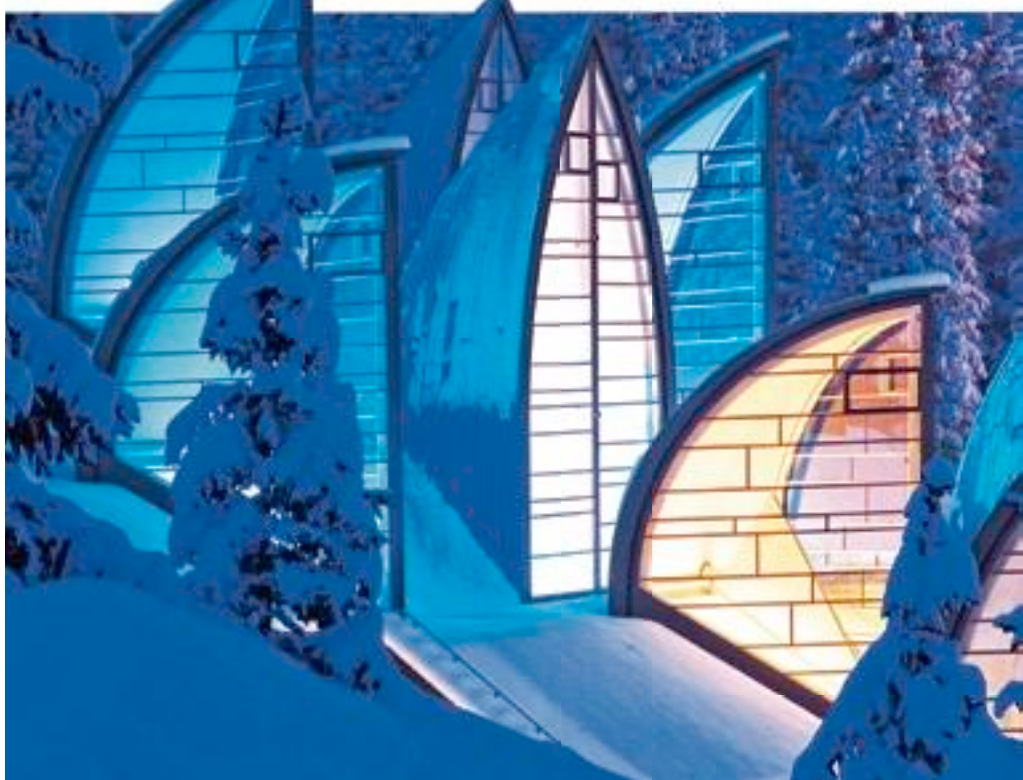
Das Tschuggen in Arosa bietet Design auf höchstem Fünfsternelevel.