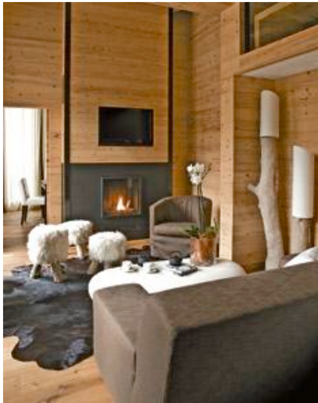
Das Hotel Post in Zermatt punktet mit stylischen Zimmern ...

Die Skisaison ist noch lange nicht vorbei. Für alle stilsicheren Pistengänger hat sich 20 Minuten nach den schönsten Designhotels in den Schweizer Bergen umgesehen - und ist fündig geworden. Ob Graubünden, Berner Oberland oder Wallis, ob luxuriös oder rustikal: Diese Unterkünfte bieten etwas für die Seele und fürs Auge.