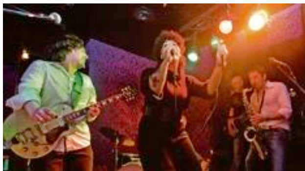
... und - allem voran - durch seine Ausgehmöglichkeiten.

sen Chefkoch (14 Gault-Millau-Punkte) kümmert sich auch um die Speisekarten der anderen beiden Restaurants, so dass auch Fajita und Spaghetti mit beinahe edlem Touch daherkommen. Besonders gemütlich ist es natürlich, wenn man nach einer langen Nacht einfach den Lift in eines der zwanzig stylischen Zimmer im Vier-Sterne-Designhotel nimmt und sich den Kater dann am nächsten Morgen im kleinen, aber feinen Wellnessbereich wegmassieren lässt. JONAS HOSKYN